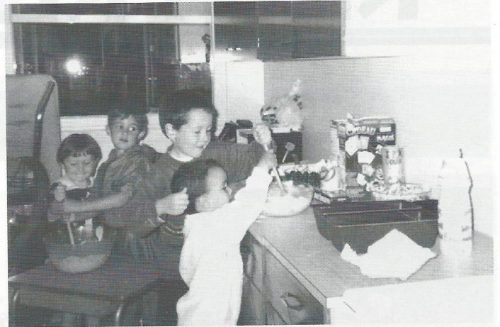
La confection d'un gâteau : toujours un grand moment.

4 semaines au centre de loisirs de la maternelle