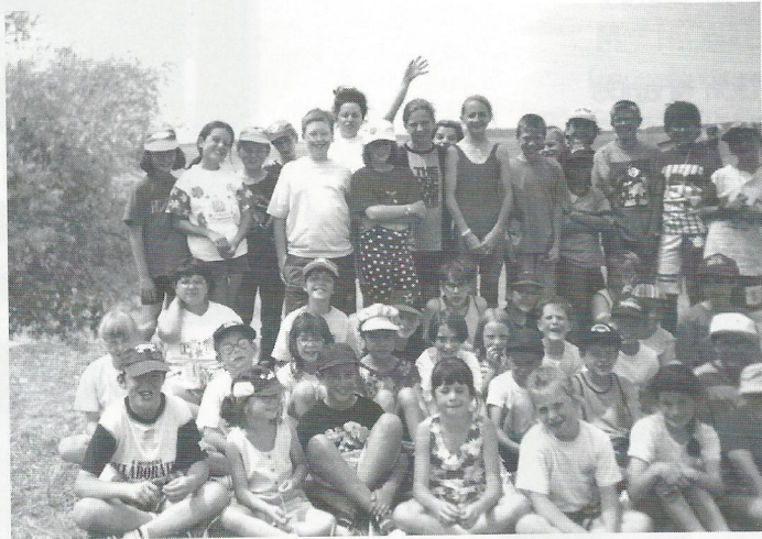
Le groupe des joyeux vacanciers !

Les enfants et l'équipe d'animation remercient la municipalité pour avoir permis à nouveau cette année la réalisation du centre. Et nous l'espérons, à l'année prochaine !