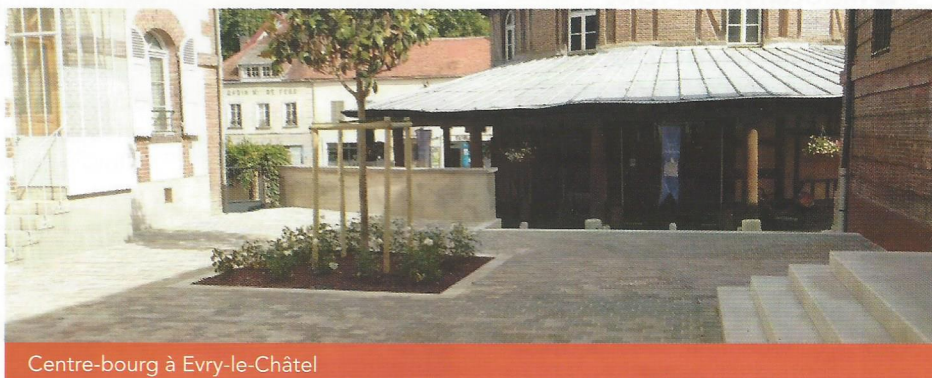
Centre-bourg à Evry-le-Châtel

Eiffage Route Agence de Troyes Tél. : 03 25 76 24 24