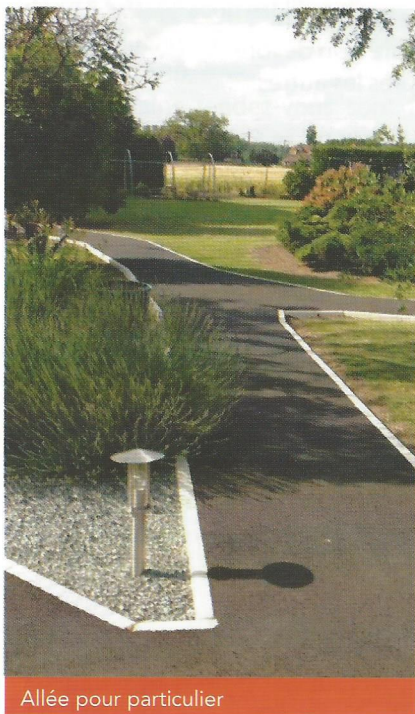
Allée pour particulier

Durant la deuxième semaine, une rencontre fut organisée avec l'Accueil de Loisirs de Savières afin de faire connaissance. Sous des rythmes musicaux les enfants ont échangé et partagé des moments conviviaux.