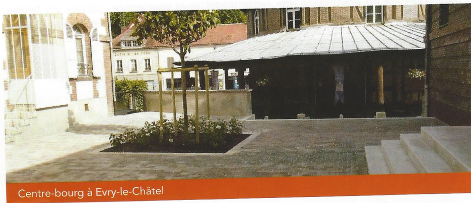
Centre-bourg à Evry-le-Châtel

Eiffage Route Agence de Troyes Tél. : 03 25 76 24 24